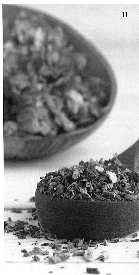
HERBEN FÜR HOMÖOPATHIE